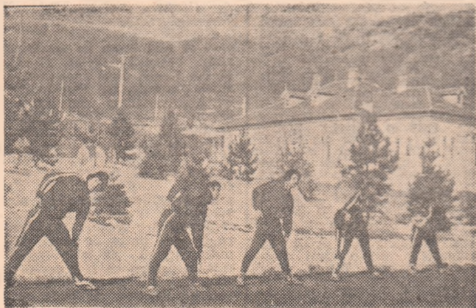
De la unul din primele antrenamente ale Gloriei Buzău pe 1979.