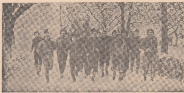
Pe potecile înzăpezite ale Snagovului, Chimia mărește timpul pentru... maratonul returului