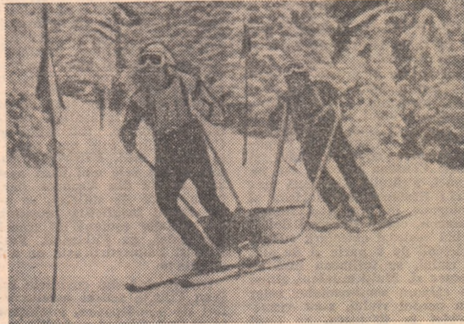
La slalomul cu akia contează nu numai viteza de coborire ci și transportul în bune condiții a celui accidentat.