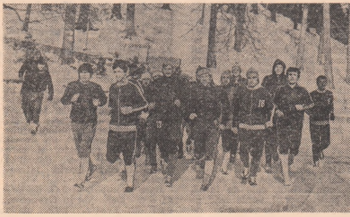
„Poli” Iași a declanșat un nou contract pe pantele care duc spre Cota 1400 ...

În afara scopului principal ur- mărit în această perioadă (dez- voltarea calităților fizice gene- rale și a forței), să vedem care sînt celelalte obiective spre care își îndreaptă atenția an- trenorul L. Antohi. Este vorba de îmbunătățirea procedeeilor tehnico-tactice de bază, perfec- ționarea celor deficitare și in- suscirea unor procedee noi le- giate de postul ocupat în e- chipă; instalarea în concepția echipei a principiilor tactice moderne prin operarea unor modificări în ideea de joc și în comportarea jucătorilor, pen- tru realizarea unor regrupări rapide în faza de apărare și pornirea explozivă în desfășu- rarea fazei de atac; participa- rea activă și creatoare la joc, ridicarea personalității jucăto- rilor, atașamentul față de muncă. În plus, ca un exper- iment ce ar putea da rezultate