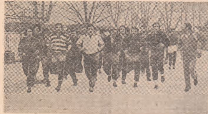
Zăpada nu constituie o piedică pentru rugbyștii Sportului studentesc, ale căror ambiții primăvărătice sînt mari...