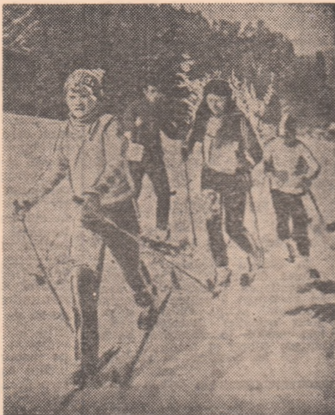
Sosire strînsă la concursul de orientare pe schiuri din Poiana Soarelui