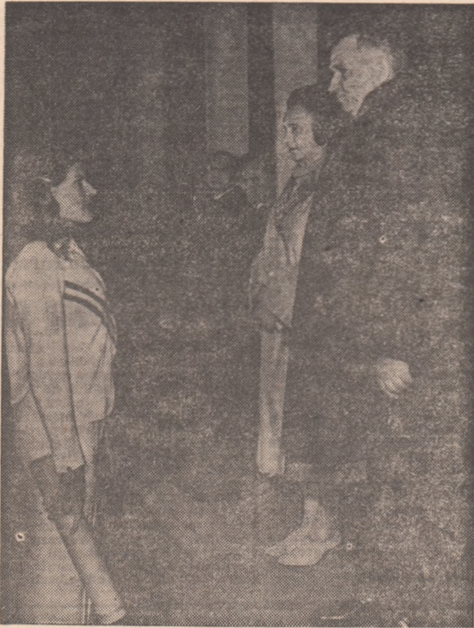
Mesajul în care se exprimă sentimentele de dragoste și de recunoștință ale sportivilor țării față de partid, de secretarul său general, este înminat tovarășului NICOLAE CEAUȘESCU de către atleta Natalia Mărășescu cu prilejul spectacolului festiv al primei ediții a „Daciadei”

La extinderea și perfecționarea continuă a sistemului unitar al democrației noastre socialiste, în centrul căreia se află Partidul Comunist Român