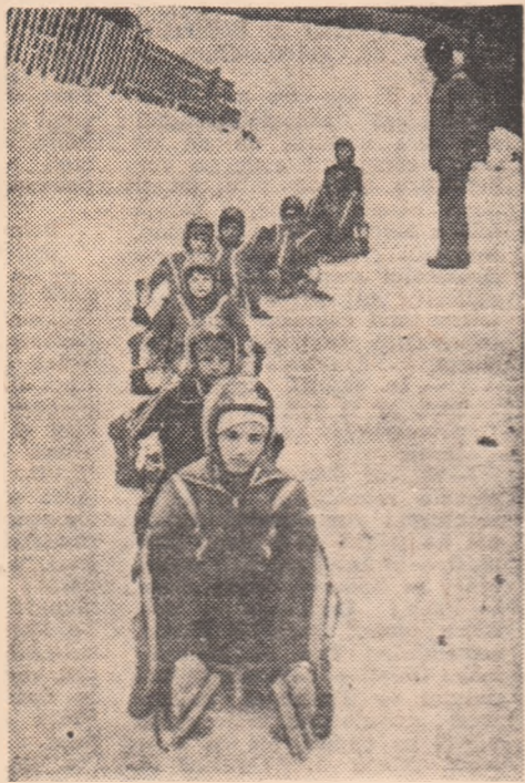
Coborire „în lanț” pe prima pirtie de sanie din țară, omologată recent la Vatra Dornei

„Urmărirea zăpezilor” a fost încununată de succes. Pe podiumuri s-au putut urca, ast-