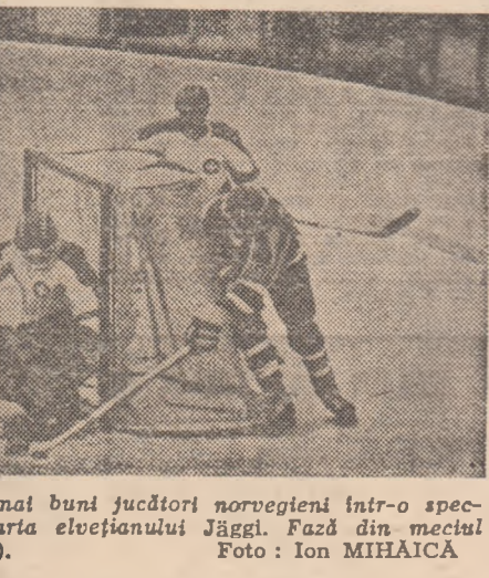
mai buni jucători norvegieni într-o spectacol elvețianului Jäggi. Fază din meciul