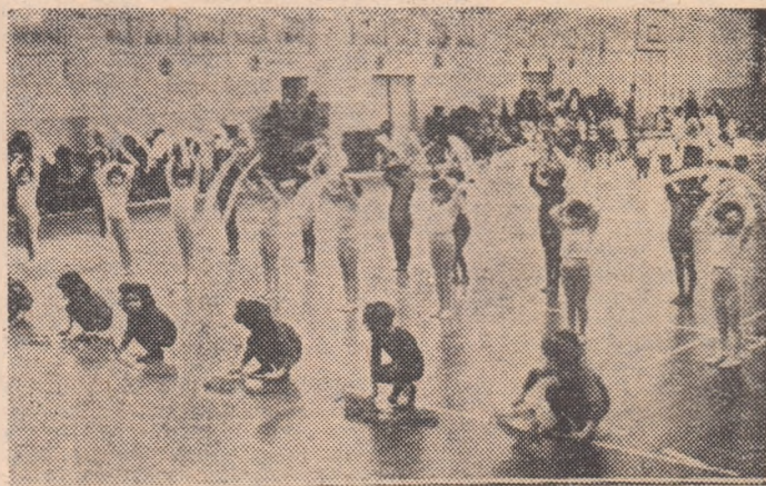
Momente aplaudate în sala de sport a Școlii generale nr. 77, gazda unui frumos concurs rezervat celor mai mici sportivi din Sectorul 3 al Capitalei

Festival cultural-sportiv dedicat Anului Internațional al Copilului