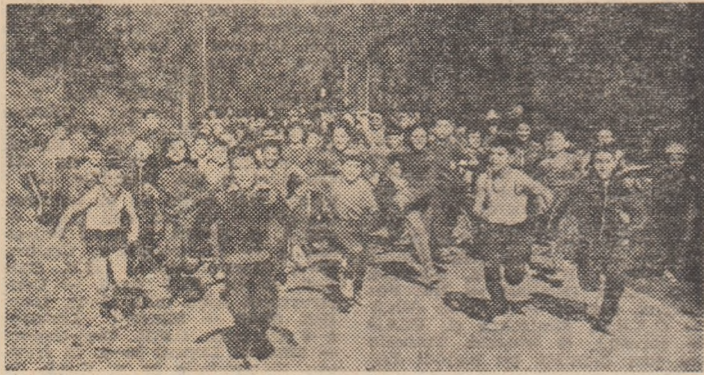
„Suvoitul” participanților la cros se lansează pe șosea...

Duminică, la Slatina, primăvara și-a etalat toate atribuțiile. Soarele și-a trimis cu dărnice razele, stîrnind coltul ierbiilor, dinău mai ieri timid, din pădurile învecinate și din zăvoaiele Oltului.