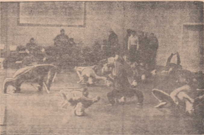
„Podul” bine executat îl scoate adesea din situații dificile pe luptătorii lași de ce exercițiul acestuia nu lipsește de la nici un antrenament.

Începând de anul trecut, Campionatele balcanice de lupte reunesc pe cei mai talentați tineri de 18-20 de ani din Bulgaria, Grecia, Iugoslavia, România și Turcia. La competiția balcanică și-au făcut debutul mulți luptători care aveau să devină apoi mari performeri: Constantin Alexandru, Ion Draica, Ștefan Rusu și alți sportivi cu mare reputație în arena internațională a luptelor s-au remarcat mai întâi pe salettele de concurs ale întrecerilor balcanice.