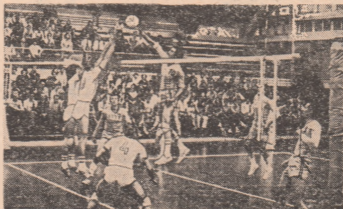
Fază din meciul România — Turcia, desfășurat ieri în sala Floresca