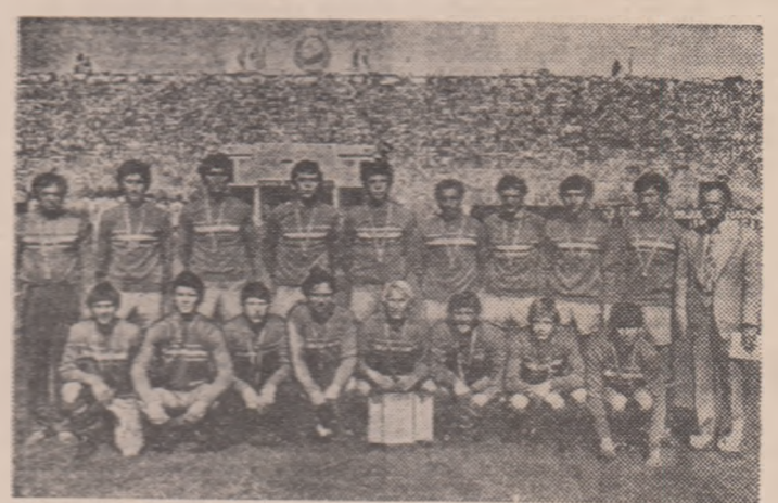
Încingătorii, marcași de efort dar fericiți, îmbrăcași cu tricourile de campioni și prezentând cupa oferită de F.R. Fotbal câștigătoarei campionatului republican de juniori.