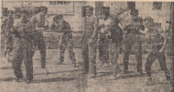
Echipa reprezentativă de box pentru Balcaniadă combină pregătirea în aer liber cu antrenamentele în sală.

— Care sînt sportivii cărora le acordați prima şansă?