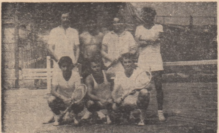
O „amintire” de la meciul de tenis cu Hidrotehnica

Are perfectă dreptate. E mai bine în fiecare zi cite puțin, decit mult, cind și cind. Iar cele văzute la Constanța sint o mărturie că „Dacia-dei” urcă viguros și pe verticalele insozrite, odată cu harnicii constructori.