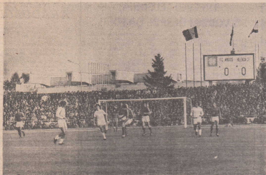
În gura Trivalei se află „marele plămîn” al sportului piteștean: grațioasa Sală a sporturilor e vecină cu elegantul stadion „1 Mai” și numeroasele anexe ale acestuia.