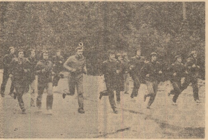
Întâi pe componenții lotului alergînd spre înălțimile Cotei 1 400

că 8 dintre ei au fost pe la lotul național A, ceea ce constituie un mare avantaj. Primul meci de verificare a fost cel cu Carpați Sinaia, dar neeficient, din cauza replicii slabe a divizionarei C. A urmat partida cu Selecționata R.P. Chineze. Rândamentul a fost mai scăzut întrucît în privința ritmului de joc. Am remarcat,