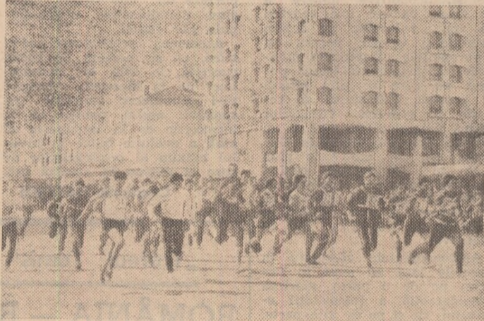
Intrecerile de cros se bucură de o deosebită popularitate în rândurile tineretului vasluian. În fotografia noastră, un aspect sugestiv de la un cros desfășurat, recent, în centrul Vasluiului

Răsfoim un leanc de foi dactilografiate, pe care sînt aliniate lungi șiruri de nume și cifre. Răsfoim o relatare exactă a bogatei și rodniciei activității sportive de masă din județul Vaslui. Bănuim în spatele bilanțului cifric tumultul zecilor de competiții organizate pe aceste frumoase plaiuri moldovene, simțim parcă, dincolo de clasamente, emoțiile firești ale primului start, dar și bucuria primei victorii, intuiim priceperea cu care au fost gândite și organizate întrecerile de către harnicii și înimoși activiști sportivi vasluieni.