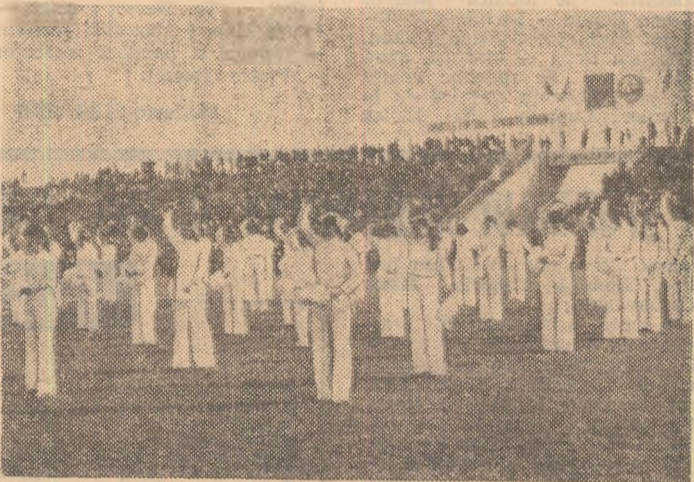
Noul și modernul stadion al municipiului Drobeta Tr. Severin a găzduit numeroase întreceri ale marilor competiții sportive naționale „Duciada” și frumoase demonstrații sportive

Județul care are pe emblema lui și o albină — simbol al hărniciei oamenilor de prin aceste locuri, dar și al unei îndelungate străbune, stupacit — a cunoscut primele semne ale mișcării sportive încă de la începutul secolului. Elevii liceului „Traian”, liceu centenar, au fost cei dintii care au practicat în mod organizat oină, gimnastica și atletismul. Generațiile următoare de elevi ai acestui veritabil lăcaș de cultură au dus mai departe inițiativa celor de la 1900, după prima conflagrație mondială numărul disciplinelor sportive sporind cu boxul, luptele, scrima, natașa și — firește — fotbalul. La 6 decembrie 1922 s-au pus bazele primului club, „Drobeta”, iar patru ani mai târziu liceenii de la „Traian” au înființat asociația „Viforul”. În 1929, „Drobeta” s-a transformat în „Zborul”, clubul axîndu-și activitatea îndeosebi pe simnastică și fotbal. Pe parcursul deceniilor sportului de pe meleagurile Mehedințului au trăit frumoase