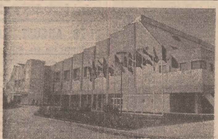
Între modernele baze sportive cu care partidul nostru a înzestrat în ultimii ani numeroase localități se află și splendidul patinoar acoperit din Galați, gazda ediției 1979 a Campionatelor mondiale de hochei pe gheață (grupa B)