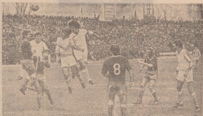
O fotografie-argument: Progresul — Rapid, un meci de Divizia B (din campionatul trecut), dar cu tribunele arhipline