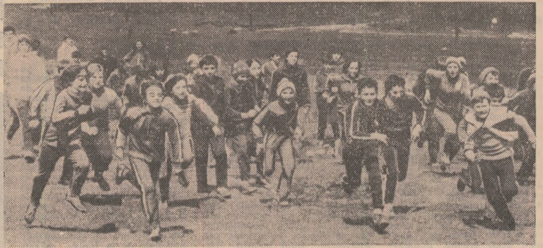
Odată cu primele zile de școală au început și bucuriile întrecerilor sportive. Marea competiție națională „Daciada” oferă copiilor numeroase prilejuri de a-și măsura puterile și voința de a învinge. În imagine, întreceri de cros la complexul sportiv Bidia din Tulcea.

Competiția națională „Daciada” se află în plină desfășurare. Timpul favorabil permite organizarea unor acțiuni interesante, atractive, în aer liber, la care participă numeroși oameni ai muncii de toate virstele și profesiile. Reporterii ziarului nostru, aflați în aceste zile în mai multe unități și asociații sportive, au surprins o serie de aspecte pozitive, care reliefează interesul deosebit cu care factorii responsabili se ocupă de transpunerea în fapte a importanțelor sarcini ce le revin în acest domeniu, dar au constatat, în același timp, și unele aspecte negative, urmarea a muncii insuficiente, a superficialității cu care este privită, pe alocuri, activitatea sportivă de masă. Se impune, așadar, ca în această perioadă să se continue cu și mai multă vigoare acțiunile din cadrul marii întreceri a „Daciadei”, să se intervină cu hotărâre pentru înlăturarea tuturor lipsurilor, astfel ca la marea competiție să participe un număr sporit de oameni ai muncii, de tineri și tinere.