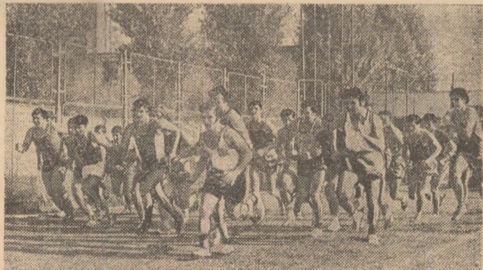
Crosurile au devenit competiții obișnuite în majoritatea întreprinderilor. În fotografie: aspect de la un cros organizat la U.R.E.M.O.A.S. București.