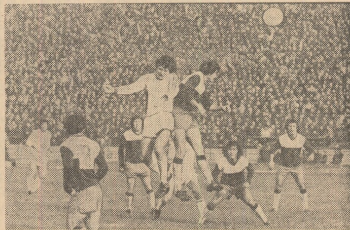
Rapid — Dinamo 2—1, din nou în fața unor tribune pline...

În ceea ce privește viitorul campionat mondial universitar de fotbal, acesta va avea loc, în anul 1982, în Mexic.