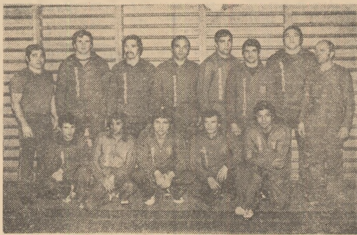
Echipa clubului Steaua, campioană și în acest an.

Titlu de campioană a fost câștigat, și de data aceasta, de formația clubului Steaua, victoria sa fiind mai clară decât