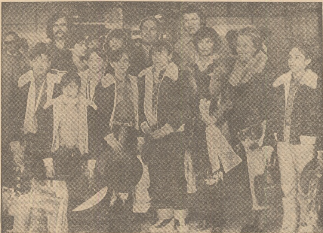
In holul aeroportului internațional Otopeni, echipa noastră feminină, împreună cu antrenorii săi și cu tehnicienii federației, răspunde solicitărilor numeroșilor fotoreporteri care au venit să o întâmpine

Impresii, declarații, opinii pe marginea strălucitului succes de la Campionatele mondiale de gimnastică