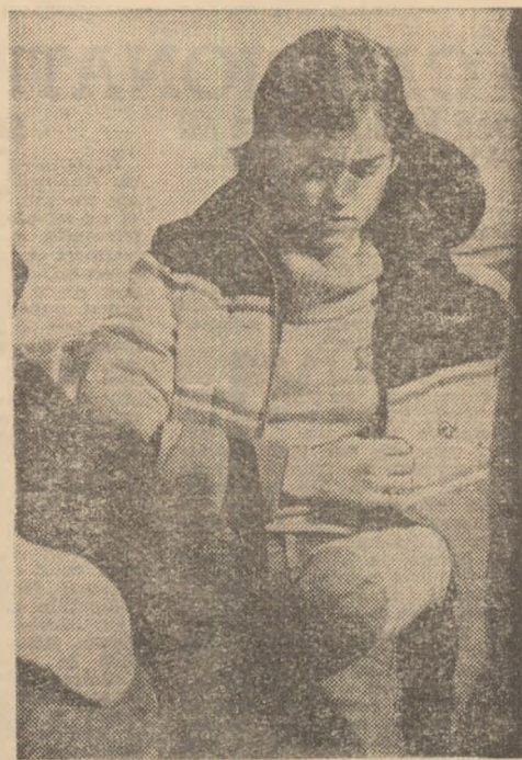
Nadia Comăneci, cu mina stângă bandajată, este încă marcată de neșansa pe care a avut-o de a nu-și fi putut dovedi încă o dată marea său talent și de a nu fi obținut succesele pe care le merita

BELA KAROLY, antrenorul echipei reprezentative: „Sintem foarte bucuroși că ne-am încheiat cu succes misiunea noastră, aceea de a reprezenta cu cinste culorile scumpe ale patriei la cea de a 20-o ediție a campio-