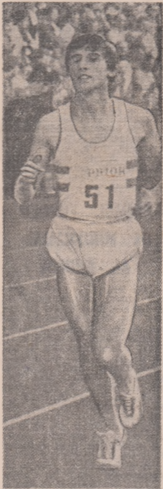
zată alături de Elliott și Juantorena. Proaspătul licențiat în științe economice al facultății din Loughborough a aruncat că va „dubla” la Moscova 800 și 1 500 m. În vîr deștepta acelu Juantorena și Ovett dar Coe a dovedit, istă, că poate mai mult decât Snel...

Rezistent, rapid și felin, Coe este un tip special de alergător, care nu poate fi comparat cu nici unul din fluștrii săi predecesori. Doar ca mentalitate (este un „front runner”) poate fi ase-