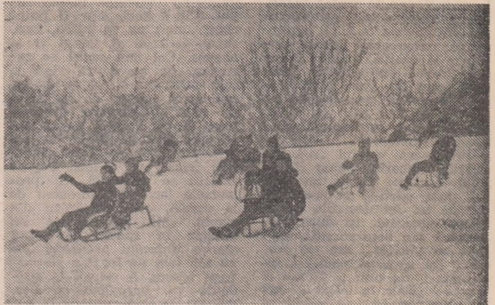
Start lansat pe unul din derdelușurile din Parcul Tineretului.

Duminică dimineață, în Capitală, pe terenurile albe ale iernii, gerul - în mare formă - conducea cu 18... sub zero! Faptul că era vorba de grade și nu de goțuri avea prea puțină importanță pentru puștimea aflată în porțile... blocurilor. Principalul era că adversarul conducea la scor. Deci, trebuia intervenit cu hotărâre, cu toate forțele. Și grabnic, în viteză, adică pe patine, schiuri și sănii.