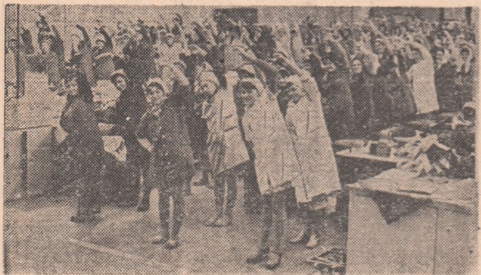
Gimnastica la locul de muncă, moment de destindere, o bine-jăcătoare cură de sănătate și voie bună