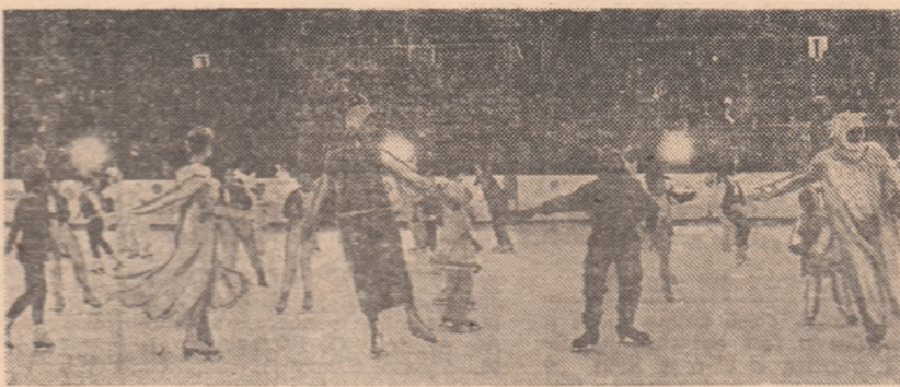
Pe oglinda de cristal al patinoarului, viitorii artiști ai gheții!...

de iarnă a marii competiții sportive naționale, au prezentat miilor de spectatori prezenți în tribune (cei mai mulți de vîrstă lor), într-un program pe cit de variat pe atît de reușit, de atrăgător, o veritabilă sinteză a unei activități sportive complexe, o ilustrare - prin sport și cîntec - a bucuriei pentru copilăria fericită ce le este asigurată, manifestîndu-și dragostea fierbinte față de cel mai iubit părinte și îndrumător al tinerei generații, tovarășul NICOLAE CEAUȘESCU, secretar general al partidului, președintele țării,