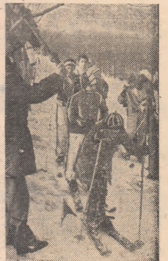
Micii schiori trăind din plin bucuriile întrecerilor „Dacia-dei” albe

Sînt participanții la cea de a 2-a ediție a „Zilelor schiului pentru tineret”, o frumoasă acțiune inițiată de C.J.E.F.S. Bistrița-Năsăud (prin prof. Constantin Sănduță, secretarul acesteia) și organizată în colaborare cu inspectoratul școlar județean, sub generosul însemn al „Dacia-dei”. Trecem de Valea Străzii, copiii sînt tot mai nerăbdători și, deodată, ne surprinde impunătoarea clădire a viitorului hotel turistic „Dracula” de pe creastă. Am ajuns. În emoționantul peisaj al munților — coline albe, pe care casele satului Frumușeni sînt răsfrînte pînă în zare, briuri de păduri ce leagă Călimanii de crestele Birgăului — organiza-