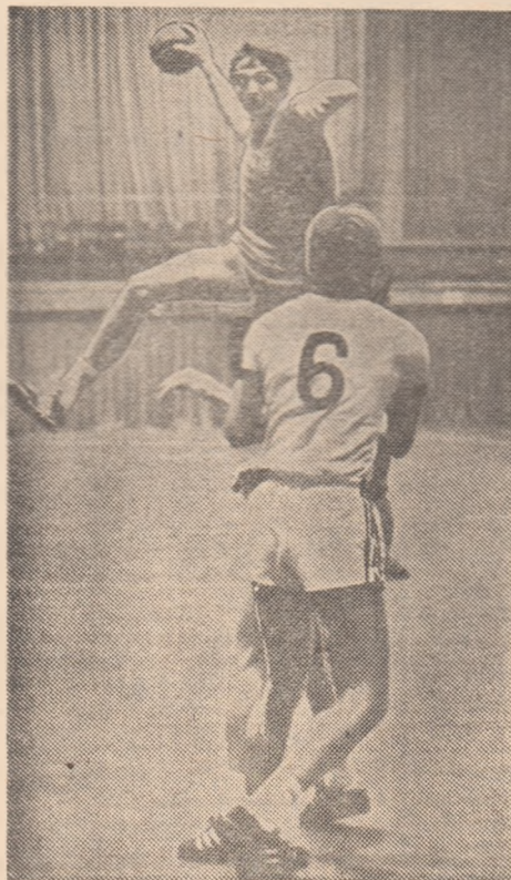
Știți de la ce înălțime pornește mingea catapultată de Ștefan Birtalan? Cam de la 3,50 m!... Acesta este unul dintre secretele eficienței golgeterului campionatului mondial de la Berlin. Detenta ca și forța se obțin în lungi și dificile antrenamente

Asistasem, de fapt, la un joc de antrenament al lotului olimpic, reunit pentru cîteva zile în vederea unor preparative comune. Fusese o „felie“ a lecției de după-amiază, care a durat 165 de minute. Același