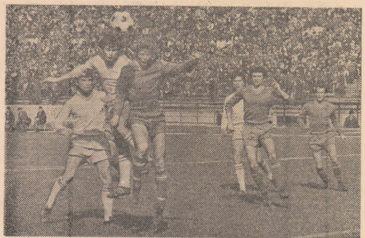
„Galbenii” și „albaștrii” au oferit un joc antrenant, cu câteva nume de perspectivă

În meciul de verificare a lotului de tîneret