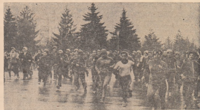
În Sectorul 2 al Capitalei, suita crosurilor continuă. După cel dotat cu „Cupa Congresului al XI-lea al U.T.C.”, desfășurat la 16 martie, duminică trecută a avut loc altul: finala pe sector a „Crosului tineretului”. În imagine: secvență din întrecerea fetelor (categoria 15-16 ani).