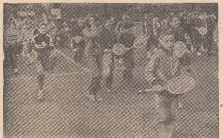
Așa arată zona terenurilor de la Tennis Club București înaintea unui concurs de selecție...