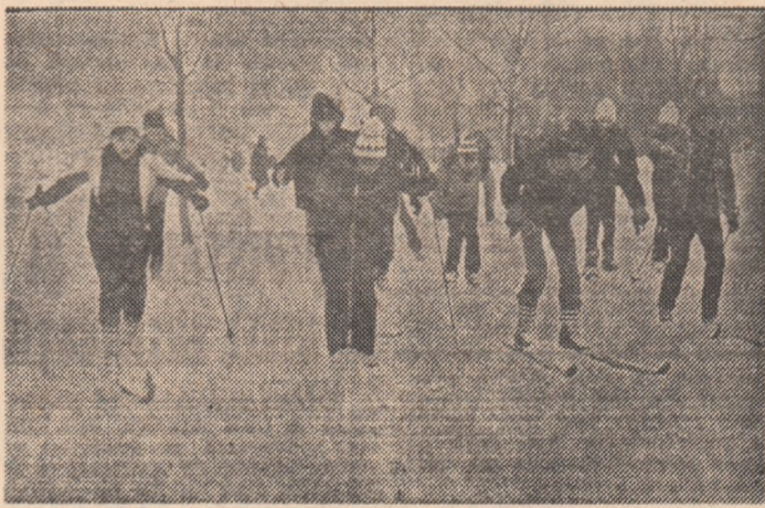
În acest an, zăpada abundentă a oferit condiții pentru schi și săniuș și în București. Iată o mărturie.

Se reamintește organelor sportive locale și celor cu atribuții în domeniul sportului că, potrivit prevederilor calendarului sportiv pe anul 1980, datele de desfășurare a etapelor „Crosul pionierilor” și „Crosul tineretului” — care trebuie riguros respectate — sînt următoarele: