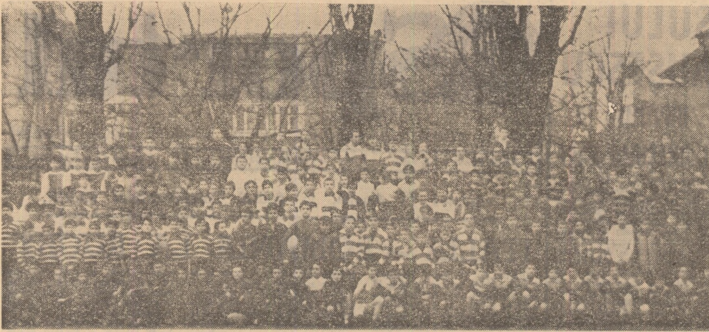
Culorile „DACIADEI“ domină Stadionul tineretului