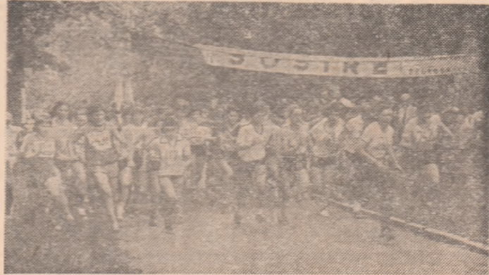
S-a dat startul la „categoria sub 19 ani”, în cadrul „Voințiadei fetelor”

Duminică a fost o dimineață frumoasă, cu cerul limpede și intens albastru. Din înaltul său, soarele și-a revărsat cu dărnice lumina peste Pădurea Păulești din apropierea Ploieștiului, unde în cadrul festivalului cultural-sportiv „Flori de mai” s-a desfășurat finala pe țară a primei ediții a „Voințiadei fetelor” la cros.