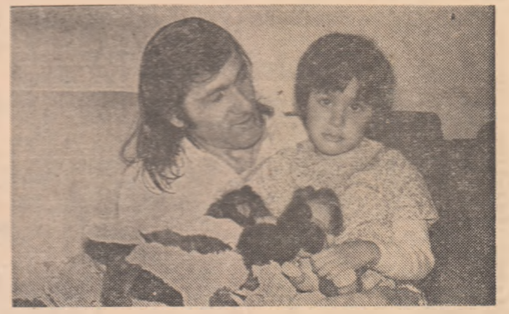
Ilie Năstase și fiica sa Natalie.

„Știu că toată lumea așteaptă de la mine realizarea a două puncte — un gînd care mă împovărează, dar care-mi și trezește sentimentul responsabilității față de tenisul românesc. Este absolut sigur că nu va fi un meci ușor. A juca în țara tenisului își dă întotdeauna un anumit complex. Mai ales că