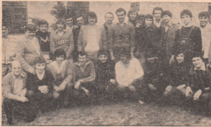
La începutul meciului de fotbal dintre echipele comunelor Pătulele și Dușanovăț, tradiționala fotografie a echipelor participante