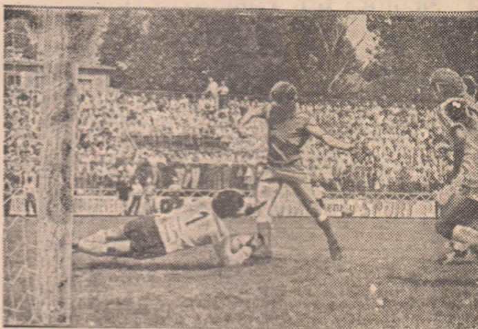
Mai rapid decit portarul Tulinschi, M. Florentin va înscrie din apropierea porții. (Progresul Vulcan — Gaz metan Mediaș 3-1)