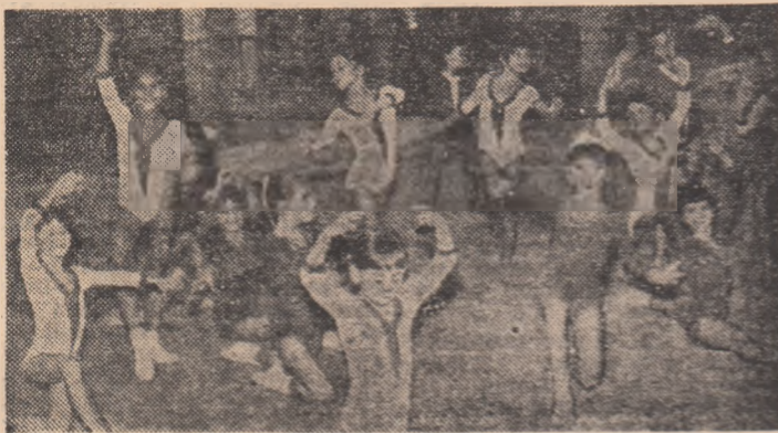
Ansamburile se bucură de o mare popularitate în școlile generale

La Piatra Neamț, finala campionatelor naționale ale școlilor generale