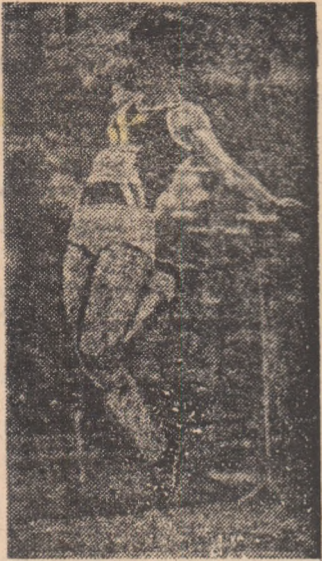
Siegrun Siegl, campioană olimpică la Montreal și fostă deținătoare a recordului mondial la săritura în lungime...