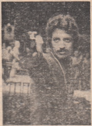
„cînd se va întimpla acest lucru la Olimpiadă. Vreau să spun, însă, că o cifră cît mai mare, vreau să spun cea mai mare din acest concurs esențial, va echivala atunci cu maximumul absolut. Cel puțin pentru moment...”

Cine cedează să nu se mai gîndească la podium! Deși poate unii au uitat faptul, eu nu pot să trec cu vederea că sînt unul dintre cei... 2 performeri din lume care au reușit, într-un concurs oficial, performanța absolută în pistolul viteză, 600 p din 600 posibile. Vreau să spun că acest maximum, reușit în 1976, mi-a făcut... multe probleme! Mi-am spus uneori că s-ar putea să fi fost o întimplare. Și, așa stînd lucrurile, alerg de 4 ani ca să repet o performanță pentru care am muncit din 1969, de cînd am început tirul de performanță. Sigur, nu e cazul să afirm