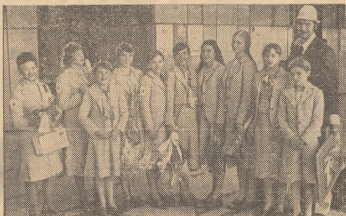
După strălucitul succes de la Montreal din 1976, gimnastele noastre din nou acasă