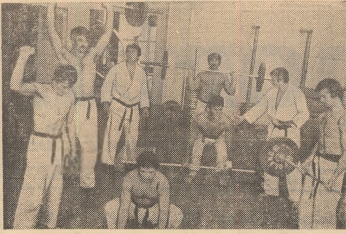
Sportivii din lotul olimpic de judo și antrenorii lor la ora exercițiilor de forță.