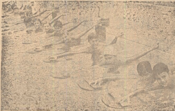
...dovadă că apa a devenit prietena copiilor.

Ne plimbăm printre grupurile care lucrează. Unii au terminat și trec, pe rând, sub dus. „Steregeți-vă bine, bine, capul”, spune profesorul; o fetiță de 7—8 ani, cu gesturi de mîmă, usucă un „delfin” mic pe care-l văzuse tremurînd; altul, care înoată bine, cere instrucțiuni