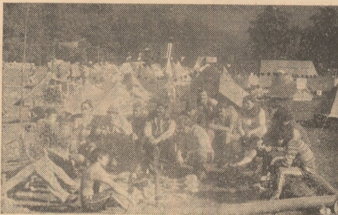
Reprezentanții județului Harghita, cîștigătorii al „Trofeului Federației române de turism — alpinism”, la focul de tabără, într-un moment de relaxare după concurs.

În fiecare an, în preajma toamnei, sportivi drumeți, reprezentînd județele țării sau unele departamente, iau parte la concursul final al turismului de masă, pentru a se stabili care sînt cei mai buni dintre cei buni în acest domeniu.