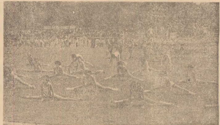
Secvență din evoluția micilor gimnaste.

Pe stadionul Dinamo și pe bazele sportive ale unor sectoare ale Capitalei (Cireșarii - sectorul 1, Voinicelul - sectorul 3, Școala generală nr. 190 - sectorul 4, stadionul Progresul - sectorul 5, stadionul Steaua - sectorul 6), ca dealtfel în întreaga țară, au avut loc ieri festivități prilejuite de deschiderea noului an sportiv școlar, universitar și de pregătire a tineretului pentru apărarea patriei. Desfășurate sub genericul mobilizator al „Daciaidei”, aceste manifestări au reunit mii de copii și tineri practicanți ai exercițiilor fizice și sportului.