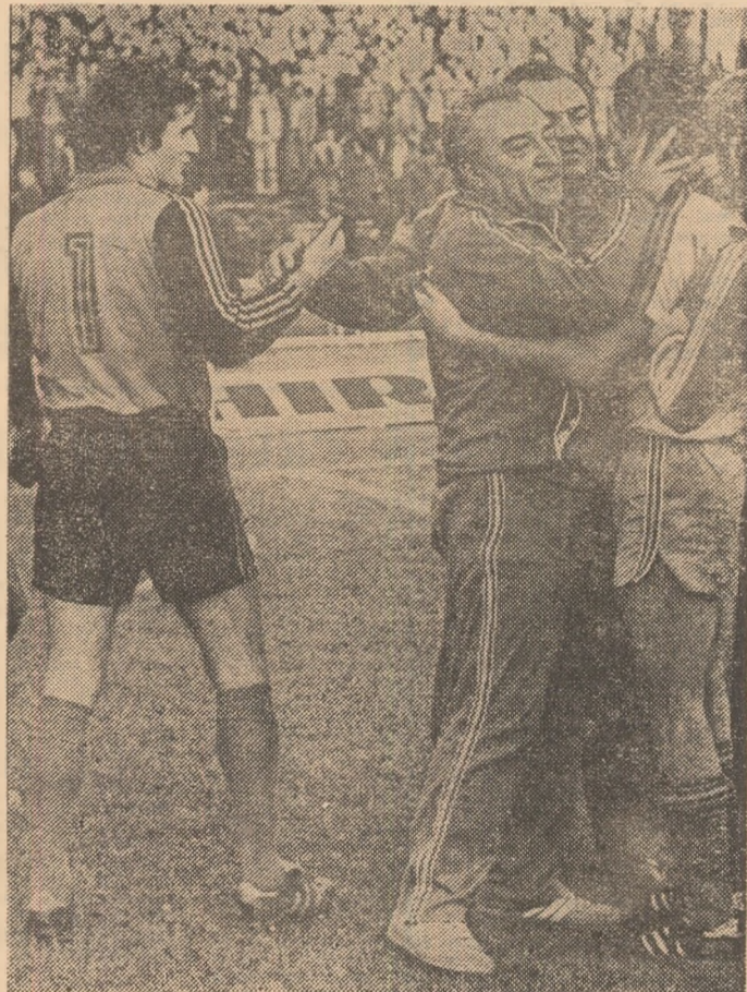
Bucuria victoriei, declanșată de cele 90 de minute disputate la „tensiune înaltă“...