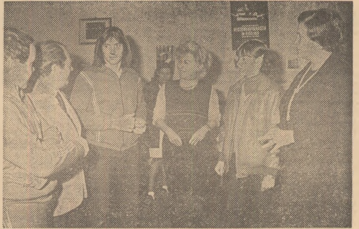
Proaspeții studenți Nadia Comăneci și Ivan Patzaichin în mijlocul cadrelor didactice de la I.E.F.S.

Nadia Comăneci și Ivan Patzaichin printre primii 10 candidați reușiți