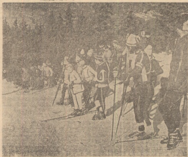
Pîrțile din Poiana Brașovului sînt gata să-și primească oaspeții. Iubitorii schiului așteaptă primele starturi...

Zăpada s-a așternut peste întinderea țării Pantele munților, pîrțile de schi își așteaptă primii competitori. Schiorii au început alunecările în viteză. Concursurile vor avea loc începînd de astăzi. Astfel, la Poiana Brașov va fi organizată întrecerea dotată cu „Criteriul primei zăpezi”. Vor avea loc curse de slalom, pentru seniori și juniori, și curse de fond. Începînd de săptămîna viitoare, competițiile de schi vor avea program non-stop!