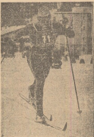
Prima cursă din actuala ediție a „Cupei Mondiale” la schi-fond, disputată la sfîrșitul săptămîinii trecute la Davos, a fost câștigată de sovieticul Evgheni Beliaev (în fotografie), care a acoperit cei 15 km ai distanței în 40:54,25.