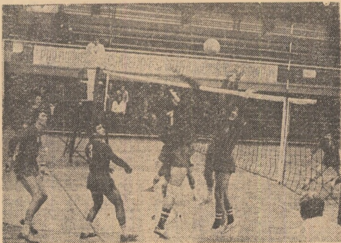
Pop (7), urmărit atent de Ion (3) și Spinu atacă decisiv peste blocajul defectuos al echipei Silvania (Popa — primul din dreapta la blocaj)

Iată componența grupelor de calificare: GRUPA A: R. F. Germania (țară organizatoare), Cehoslovacia, Scotia, Israel; GRUPA B: (în Bulgaria): Bulgaria, Olanda, Irlanda; GRUPA C (în Finlanda): Finlanda, România, Belgia; GRUPA D (în Suedia): Suedia, Anglia, Ungaria.