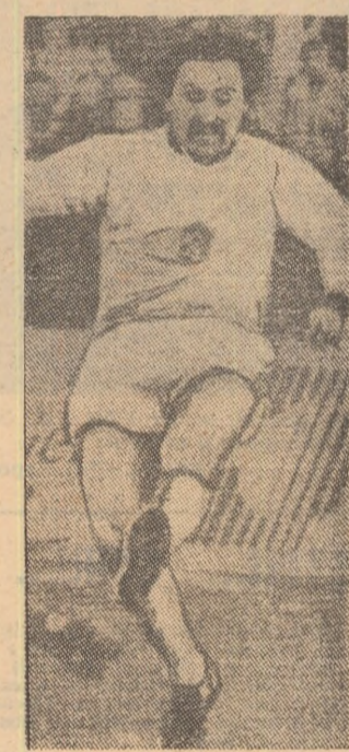
Jucătorul Antonin Panenka (Bohemians Praga) a fost desemnat cel mai bun jucător al Cehoslovaciei in 1980. In clasament el este urmat de alţi doi internaţionali, componenţi ai formaţiei Dukla Praga: Vizek şi Kozak.

Francezul Bernard Hinault consideră, la rîndul său, că pentru etapa actuală nu este recomandabil ca amatorii să participe la aceste curse deosebit de grele. „In schimb, a adăugat campionul mondial, ar fi interesant ca profesioniştili să participe la unele curse de amatori, cum sînt de pildă „Tour de l'Avenir“ şi „Cursa Păcii“.