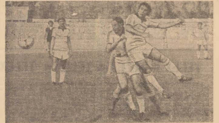
Chiar dacă și în meciul cu Dinamo, de la București, ieșenii s-au apărât grupat, greșelile flagrante ale ultimului apărător al buturilor au stabilit proporțiile eșecului, ca și în alte partide.