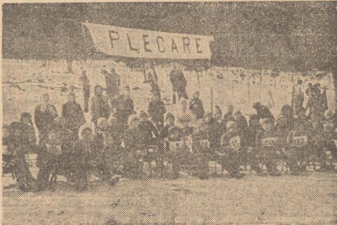
La Valra Dornei a nins. „Dacia albă” are pirtie deschisă...