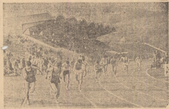
Fotografie simbol pentru atletismul bătând în mod sigur este într-o permanentă ofensivă și în acest sport.

rile de echipă, fie de cele individuale. La acestea din urmă vrem să zăbovim în rândurile de față, în urma unei scurte vizite făcute la C.S.M. Baia Mare.