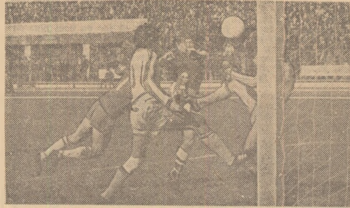
Studentii bucureșteni luptînd din greu în apărare pe teren propriu. Fază din meciul Sportul studentesc — F.C. Argeș, cîștigat de oaspeți cu 3-1.

Inceput de august 1980. Sportul studentesc — cîștigătoarea Cupei balcanice — cu trei achiziții de marcă (Fl. Grigore, Bozeșan, Bucurescu) și avînd la „tîmonă” un nou cuplu de antrenori, C. Cernăianu — I. Voica, amîndoi tehnicieni valoroși, care activaseră multă vreme și în cadrul lotului național, s-a prezentat la startul noului an competițional ca UNA DINTRE PRINCIPALELE PRETENDENTE ÎN LUPTA PENTRU TITLU sau — cel puțin — ca o aspirantă la un loc pe podium.