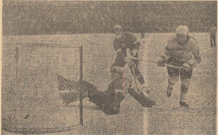
Fază din meciul România — Ungaria (11—3) disputat miercuri: Axinte înscrie primul gol pentru echipa noastră.

ANUL XXXVII — Nr. 9674 4 PAGINI — 30 BANI Vineri 9 ianuarie 1981