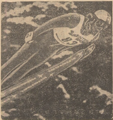
Ciștigătorul „Turneului celor 4 trambuline”, austriacul Hubert Neuper (în fotografie), și-a consolidat poziția de lider în „Cupa Mondială” la sărituri cu schiurile, pe care a deținut-o și la trecuta ediție.

Proba masculină de 500 m din cadrul concursului internațional de patinaj viteză de la Innsbruck a revenit sovieticului Serghei Slobnikov, cu timpul de 38,55. În proba de 1000 m coechipierul său Vladimir Lobanov a câștigat în 1:18,45. În competiția feminină, patinatoarea poloneză Erwina Rys a terminat învingătoare în două probe: 500 m — 43,44 și 1000 m — 1:27,26.